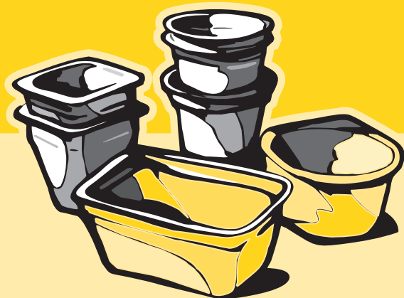
Kelímky od jogurtů, krabičky od pokrmových tuků